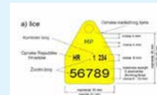
markica za ovce