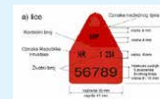
markica za koze